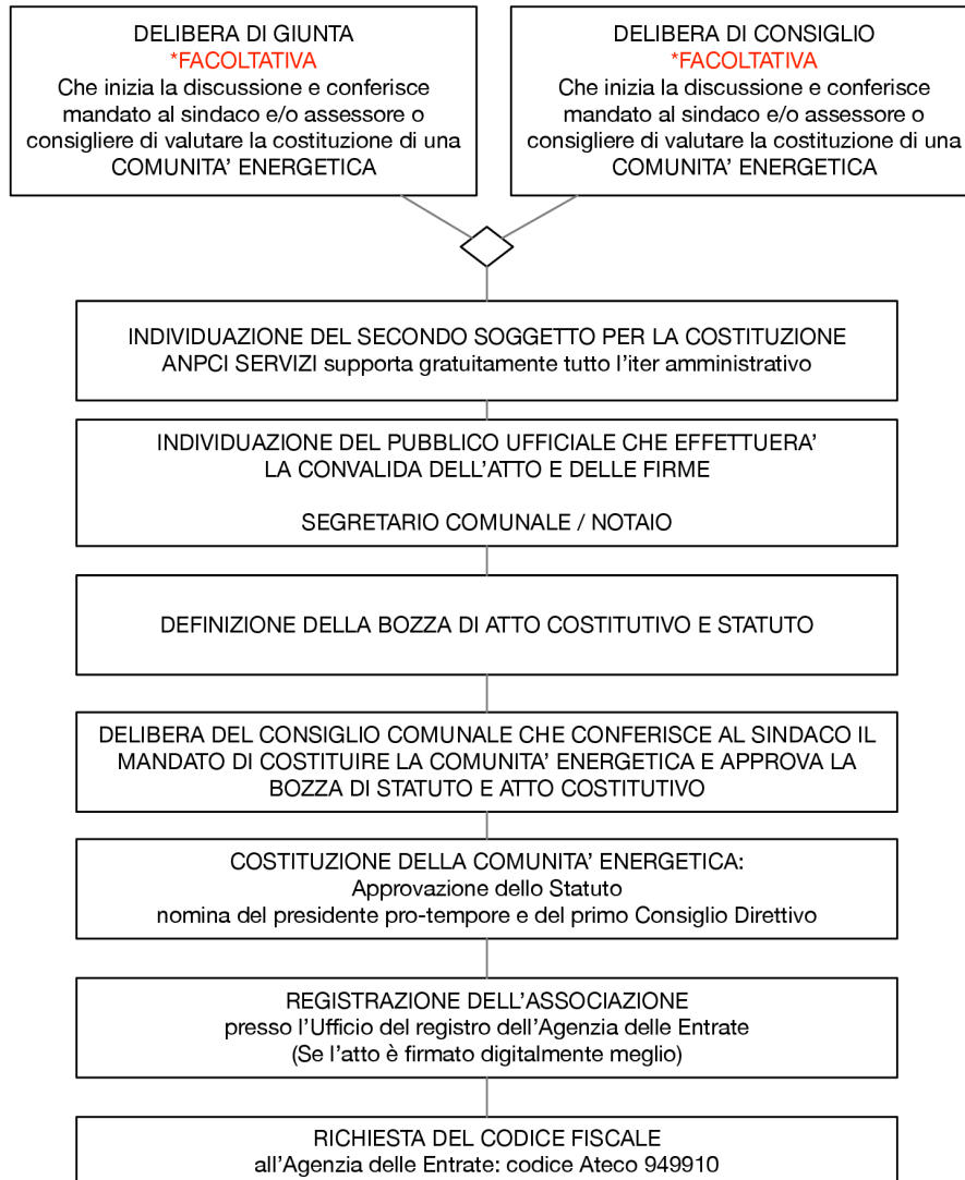
Figura 2: schema di costituzione di una CER.

Una volta registrata e attribuito il codice fiscale, la CER è operativa.