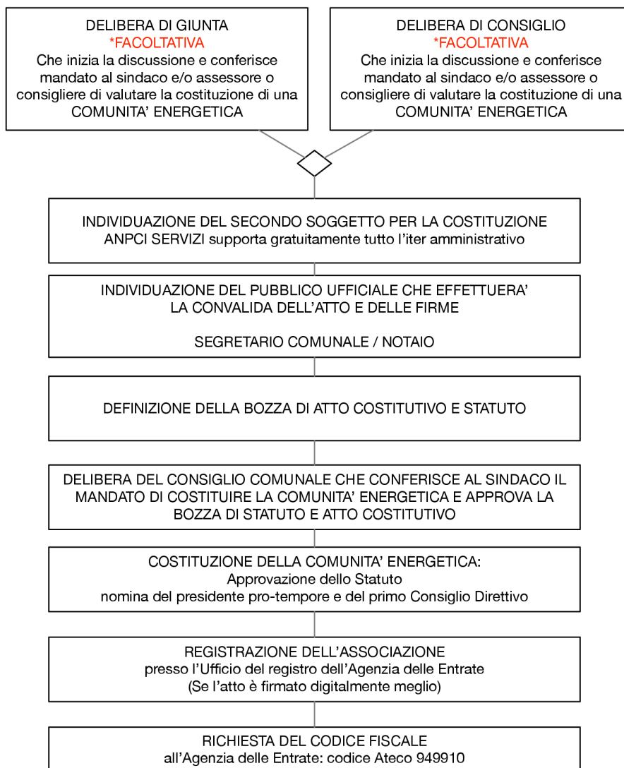
Figura 2: schema di costituzione di una CER.

Una volta registrata e attribuito il codice fiscale, la CER è operativa.